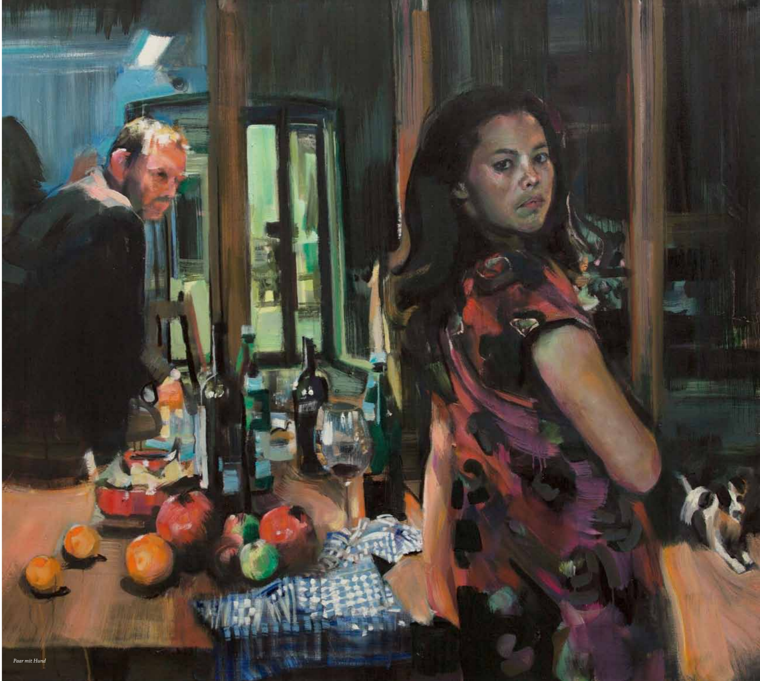
Paar mit Hund

In Markus Frägers Arbeiten hat es oft den Anschein, als sei die barocke Bildsprache in der modernen Lebenswelt angekommen. Beim Betrachter lösen gestaltete – vermeintliche - Alltagssituationen eine gewisse Ratlosigkeit aus. Denn die Malerei Frägers, die Anatomie, Perspektivität und